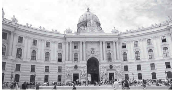
Die Hofburg in Wien

Sie enthalten: Bahnfahrt, Hotelübernachtung mit Frühstück, Karte für den öffentlichen Nahverkehr in Wien, Stadtrundfahrt und Fußführung im Zentrum Wiens, Schloss Schönbrunn und Hundertwasserhaus.