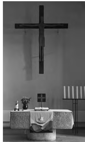
Die Neuenhäuser Kirche