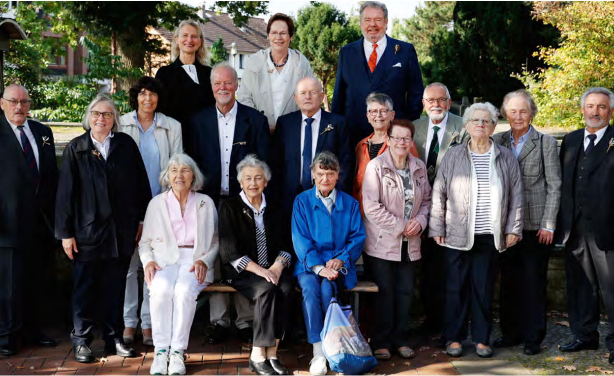
Konfirmationsjubiläum in Neuenhäusern am 26. September 2021