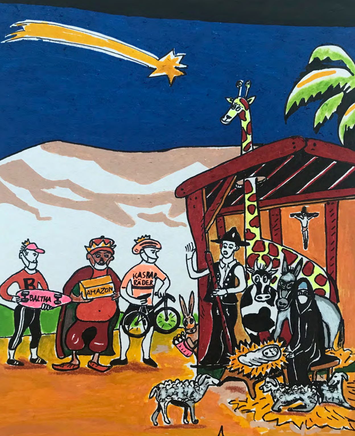
Wir wollten uns doch dieses Jahr nichts schenken