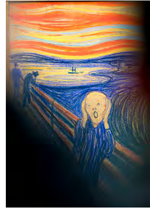
Edvard Munch: Der Schrei

Das Kind in der Krippe ist klein, aber es verbreitet eine große Zuversicht. Zuversicht und Engagement, statt Furcht – das wäre ein guter Weg in und durch das neue Jahr.