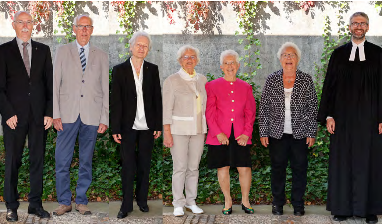
Diamantene, Eiserne & Gnadene Konfirmation in der Kreuzkirche