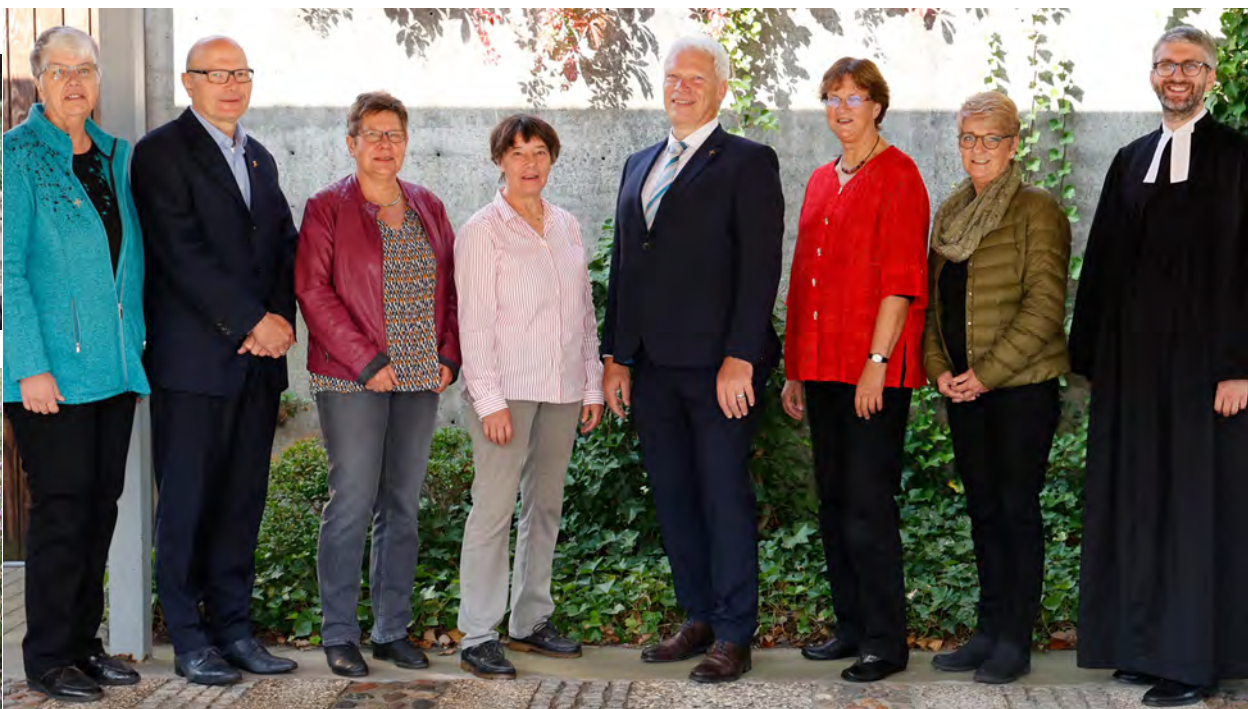
Goldene Konfirmation der Kreuzkirche