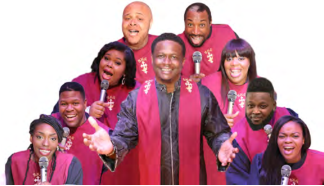
Harlem Gospel aus New York in der Kreuzkirche